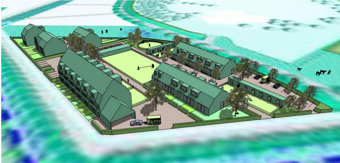
rekenmodel Huis & Paard: Almere Hout Noord, Laura Weeber Architect

Het uiteindelijk bouwplan wordt bepaald door de samenstelling van de bouwgroep. Samenwonen met paarden staat hierbij centraal. Succes van het project is niet afhankelijk van de inkomensgroep of gezinssamenstelling van de deelnemers. Onderstaande gegevens zijn daarom slechts ter indicatie.