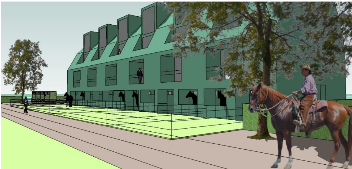
rekenmodel Huis & Paard: Almere Hout Noord, appartementen , Laura Weeber Architect

Door te bouwen in Collectief Opdrachtgeverschap is het mogelijk om woningen te realiseren, waarvan de vrij-op-naam prijs onder de marktwaarde uitkomt. Het is goedkoper doordat er geen ontwikkelaar bij betrokken is, die winst moet maken op het project. Diensten van architect en adviseurs worden collectief ingekocht, het project wordt als één project aanbesteed bij de aannemer.